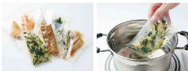
(写真左)風味を逃さないスマイルパック。(写真右)湯煎15分でできたての美味しさです。

オーケーズデリカのチルド惣菜「スマイルパック」は、三重県・愛知県・岐阜県の老人ホームやデイサービスなどの介護施設に向けてお届けしています。お弁当を長年作り続けてきた経験を活かし、「パックなんておいしくない」という先入観を覆すような美味さと彩りのスマイルパック。第2工場の誕生を機にもっと多くの人にそのよさをお伝えしたいと考えています。